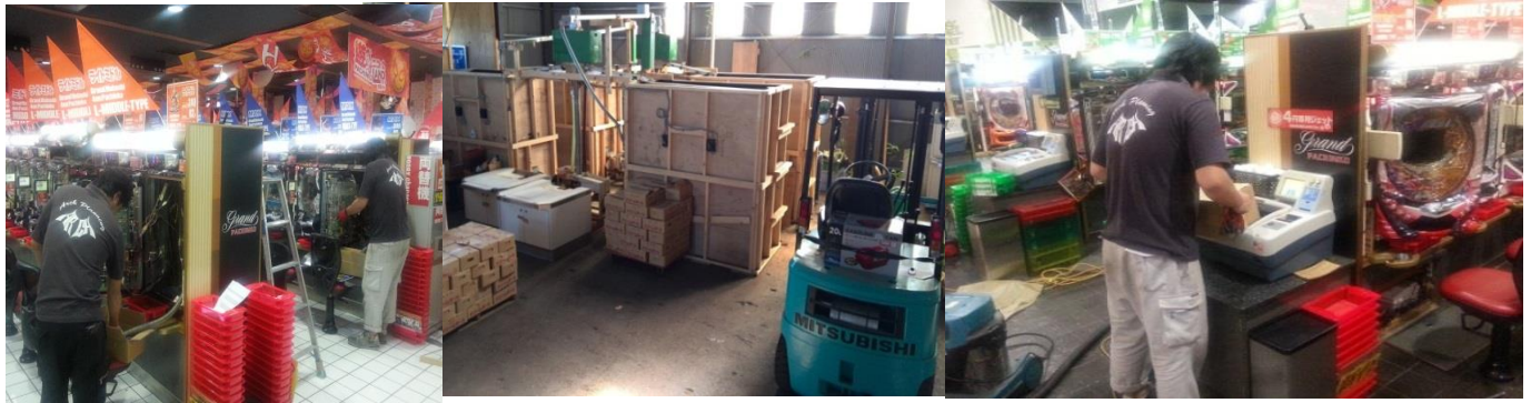
玉搬入・玉入れスタッフ